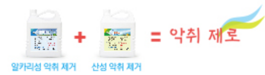
알카리성 악취 제거 산성 악취 제거