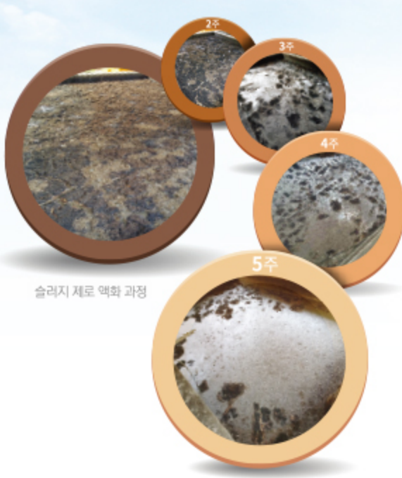
슬러지 제로 액화 과정