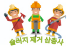
슬러지 제거 삼총사

효능으로 입증된 슬러지 제거 삼총사! 그 효과를 아래 동영상에서 확인하세요!